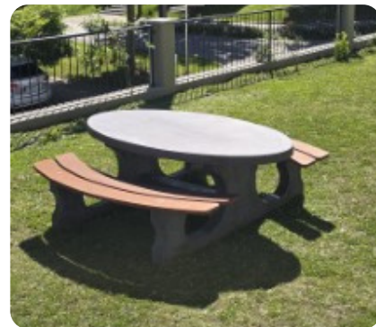
neue Sitzgelegenheiten innen und außen