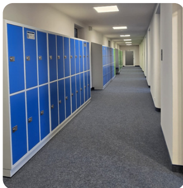
Fertigstellung des letzten Bauabschnitts