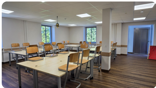
neuer Fachraum Kunst