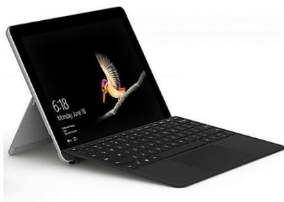
Microsoft Surface Go2 + Type Cover ( 64 GB oder 128GB)

Bei der Wahl der Einsatzmöglichkeiten im Alltag werden wir uns an dem von uns empfohlenen Produkten orientieren: https://www.cotec.de/