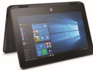
HP ProBook x360 11 G1

Vergessen Sie auch nicht den passenden Stift! Geben Sie beim Bestellvorgang an, dass die Schule das DBBC ist, dann benötigen Sie keinen weiteren Schulzugehörigkeitsnachweis .