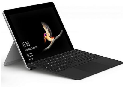
Microsoft Surface Go + Type Cover ( 64 GB oder 128GB )

Bei der Wahl der Einsatzmöglichkeiten im Alltag werden wir uns an dem von uns empfohlenen Produkten orientieren: