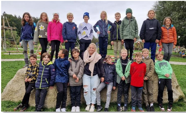
↑ Klasse RS 05

Noch schnell ein Gruppenfoto – und ab zurück zur Unterkunft.