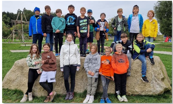
↑ Klasse MS 05